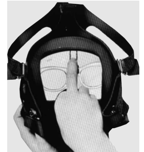
Abb. 4 Fig. 4

Ultra Elite spectacles: Position tension adapter on the square recess in the faceblank (see picture on front page).