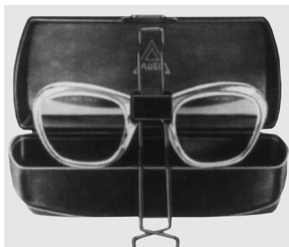
Abb. 5 Fig. 5

Maskenbrillenerfassung Größe 46/24, ohne Gläser, Federbügel mit Halterung, Putztuch, Etui.