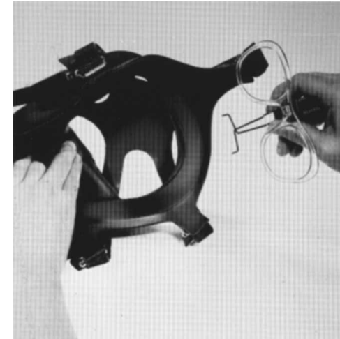
Abb. 3 Fig. 3

Maskenbänderung nach außen umlegen Place head harness over mask