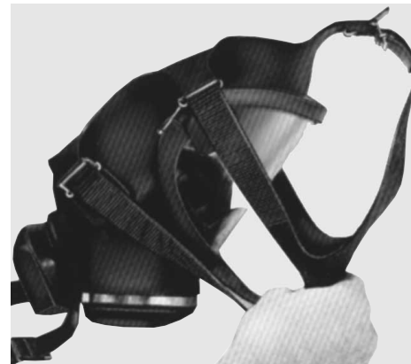
Abb. 2 Fig. 2

Maskenbänderung nach außen umlegen Place head harness over mask